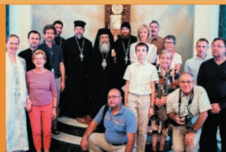
Le groupe de pèlerins entourant SB Théophile III, Patriarche de Jérusalem