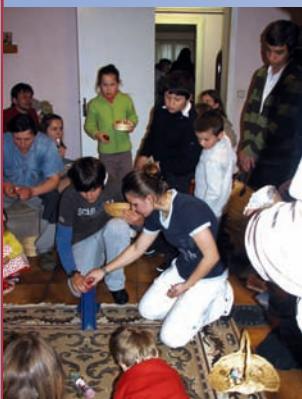
jeux traditionnels de pâques dont nous attendons les règles de jeu!!