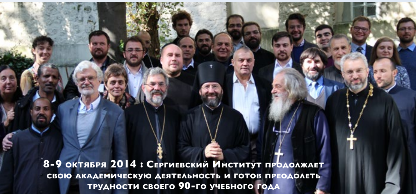
8-9 октября 2014 : СЕРГИЕВСКИЙ ИНСТИТУТ ПРОДОЛЖАЕТ СВОЮ АКАДЕМИЧЕСКУЮ ДЕЯТЕЛЬНОСТЬ И ГОТОВ ПРЕОДОЛЕТЬ ТРУДНОСТИ СВОЕГО 90-го УЧЕБНОГО ГОДА